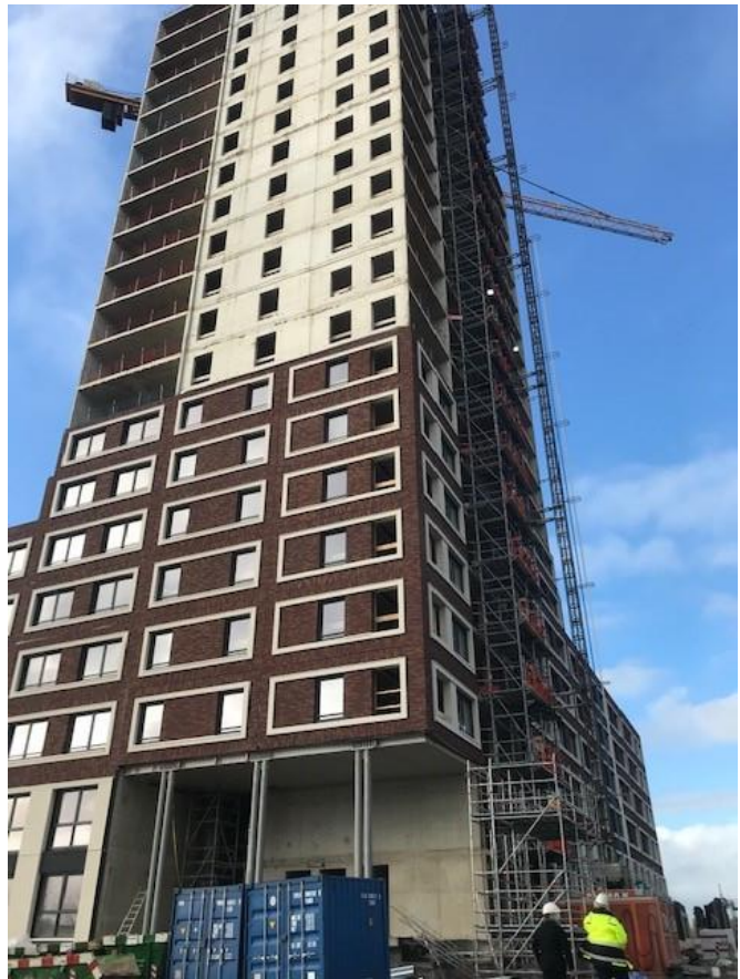
Bovenstaande en de hiernaast (rechts) weergegeven foto's laten de betonbouw en het monteren van de gevelementen zien