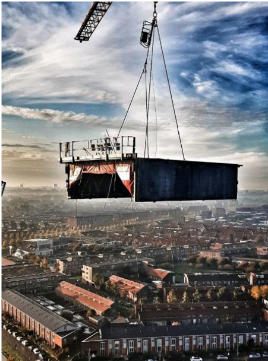
Bovenstaande foto betreft een tunnelkist welke hangt in de torenkraan. Met het tunnelkist systeem is de betonbouw gerealiseerd.