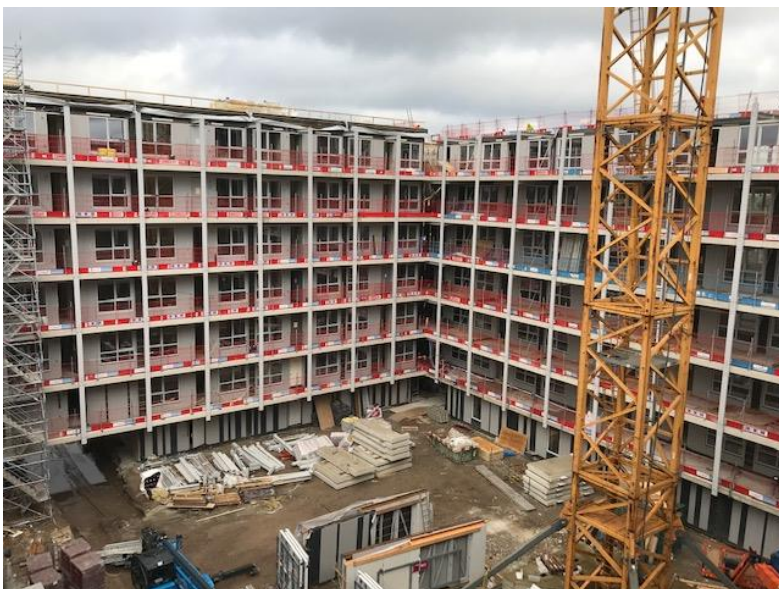
De hiernaast (links) weergegeven foto geeft een goed beeld van het binnenterrein van de Hofbadtoren. Hier zullen ook de parkeerplaatsen voor de bewoners van de Hofbadtoren worden gerealiseerd.